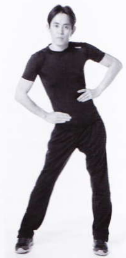
図1 徒手による腸管へのアプローチ

セル・エクササイズは自律神経機能を向上することで、セル(cell)すなわち細胞への必要十分な血流確保を目的とした次世代のコンディショニング、トレーニング法である。